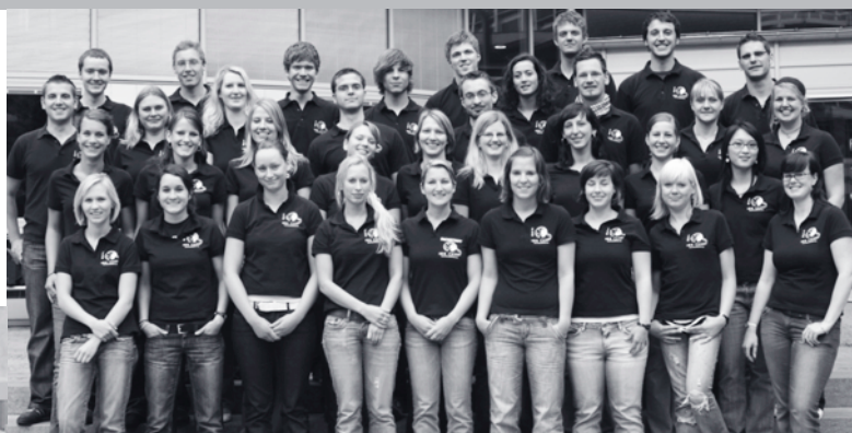
Above: Members of the FSC IBS in June 2008