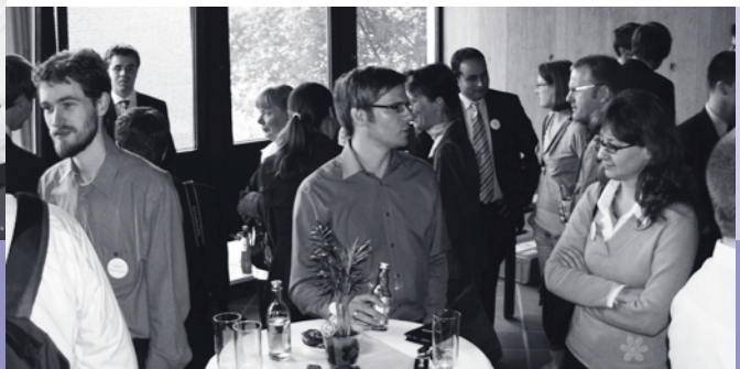
Oben: Das DS&OR Forum bot neben vielen Vorträgen zahlreiche Gelegenheiten zur Kontakt- und Netzwerkpflege.