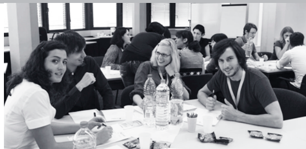
Above: Participants at the anniversary workshop of Jobware developing a marketing concept for later presentation.