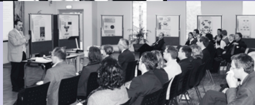
Oben: Start des interdisziplinären Kompetenzzentrums für Berufsbildungsforschung – cevet (Centre for Vocational Education and Training) – im März 2008