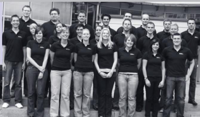
Above: Members of the FSC for Business Administration and Economics