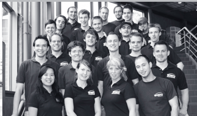
Above: Faculty Student Council for Business Information Systems in the 2008 summer term