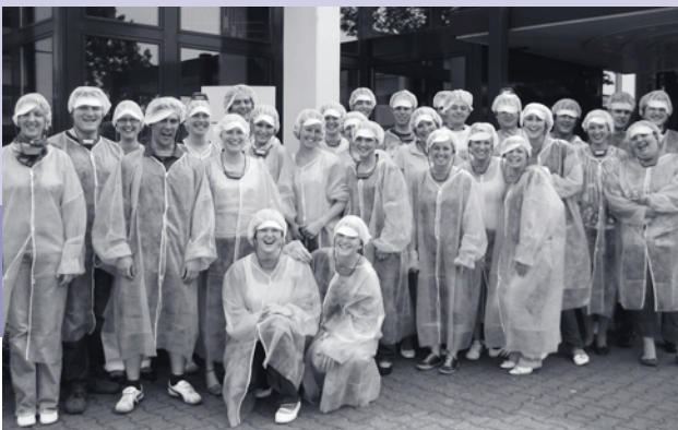
Above: Study trip to Düsseldorf: Guided tour of Teekanne

The FSC is available for consultation during its office hour Monday to Thursday in room C2 232. During this time students can also book a projector for use on University premises. It also runs a study notes service and organizes the evaluation of all study modules offered by the Faculty of Business Administration and Economics (in cooperation with the Faculty Student Council for International Business Studies and Business Information Systems). New members are welcome at any time!