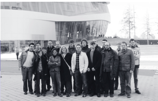
Above: Study trip to the Mercedes-Benz Museum in Stuttgart

FACULTY OF BUSINESS ADMINISTRATION AND ECONOMICS STUDENT INITIATIVES FACULTY STUDENT COUNCIL AND STUDENT GROUP FOR BUSINESS INFORMATION SYSTEMS