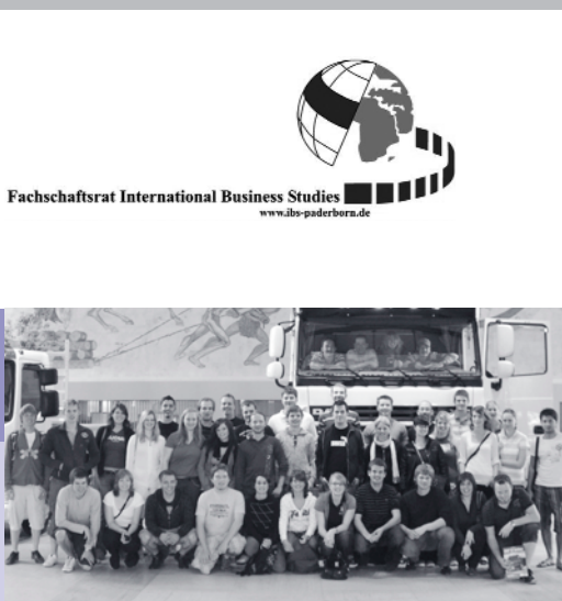
Above: Study trip participants at a “truck stop” at DAF

FACULTY OF BUSINESS ADMINISTRATION AND ECONOMICS STUDENT INITIATIVES FACULTY STUDENT COUNCIL “INTERNATIONAL BUSINESS STUDIES” (FSC IBS)