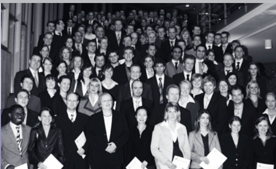
Oben: Graduierte und Promovierte nahmen ihre Urkunden am „Tag der Wirtschaftswissenschaften“ in Empfang.

FAKULTÄT FÜR WIRTSCHAFTSWISSENSCHAFTEN FACULTY OF BUSINESS ADMINISTRATION AND ECONOMICS EVENTS