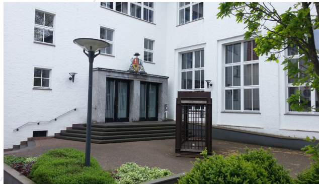
Audimax der Theologischen Fakultät